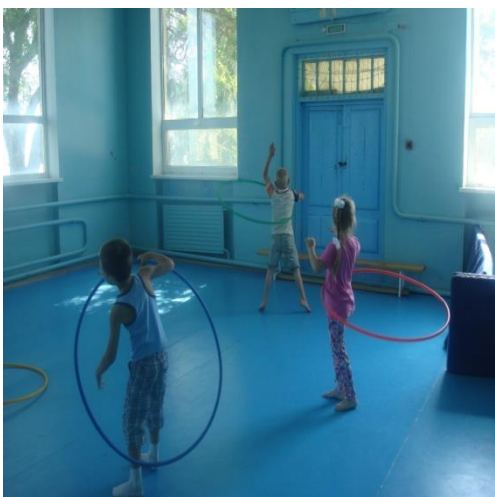
Руководители летней площадки «Радуга»